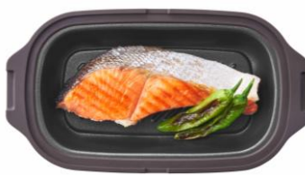
電子レンジなのに焼き目がくっきり