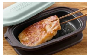
余分な脂を落としてヘルシーに！