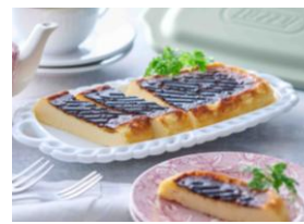
バスクチーズケーキ