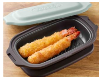
揚げ物の温め直しもサクッと仕上がる