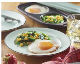
ハムエッグとほうれん草ソテー