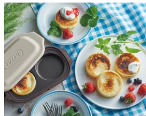
ヨーグルト蒸しケーキ