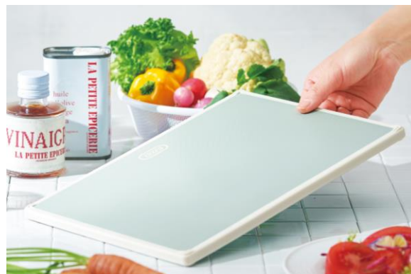
持つと実感する軽さ！