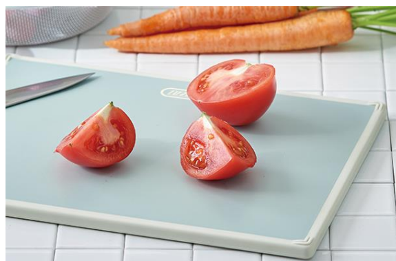
Ag + 抗菌で清潔&安心！